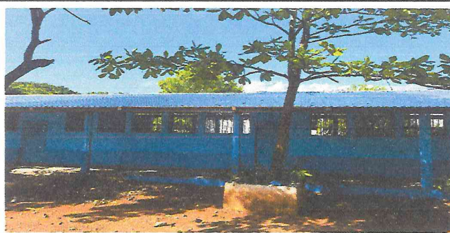
Foto.5, sustitucion de techo con estructura metalica y enlaminado