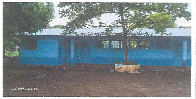
Foto, 4 cambio de lámina a lámina troquelada