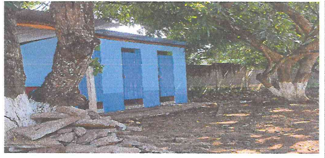
Foto 2. Pintado