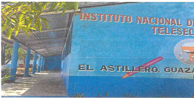
Foto 3. Demolicion y restitution de piso de concreto