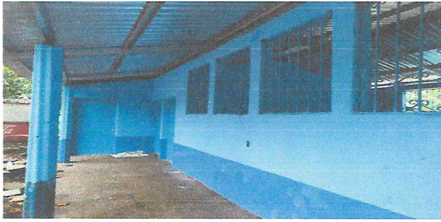
Foto 1. Ilijado y pintado de balcones